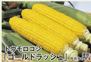
トウモロコシ 「ゴールドラッシュ」

莢は濃緑で着莢がよく、多収。大粒でボリューム感があり、食味に優れる。播種後75日程度で収穫ができる早生種。