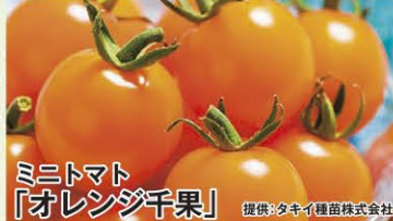
ミニトマト 「オレンジ千果」

みずみずしさとサクサクとした食感が楽しめる品種。暑さに強く、うどんこ病、べと病、ウイルス病にも強い、減農薬栽培をする方にもおすすめ。