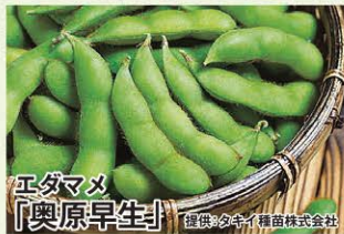
エダマメ 「奥原早生」

果皮はやや厚めで、果肉はとろけるほど柔らかく食味は最高。火の通りが速く、麻婆ナスの食材としても最適な品種。