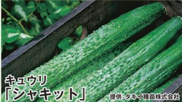
キュウリ 「シャキット」