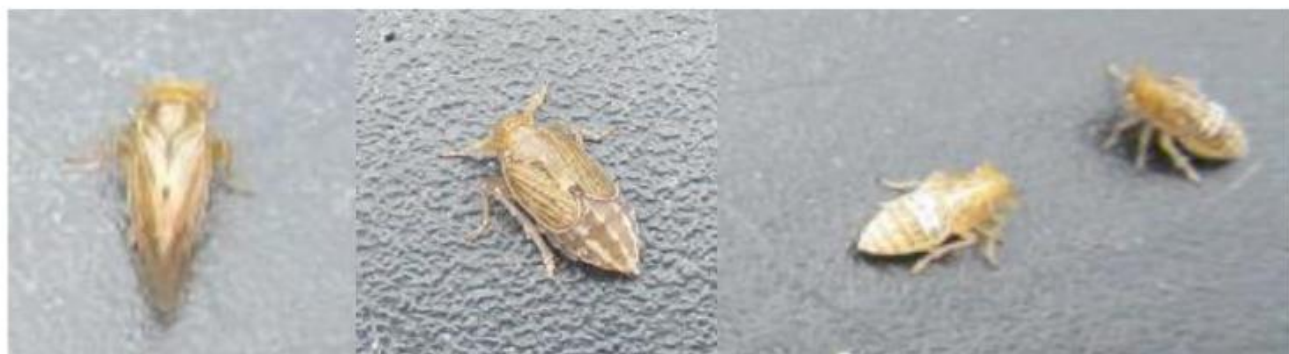
トビイロウンカの長翅型成虫 (左), 短翅型成虫 (中央), 老齢幼虫 (右2頭)